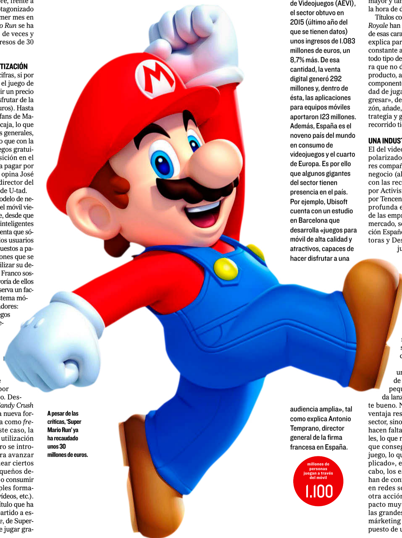
A pesar de las críticas, 'Super Mario Run' ya ha recaudado unos 30 millones de euros.

millones de personas juegan a través del móvil 1.100